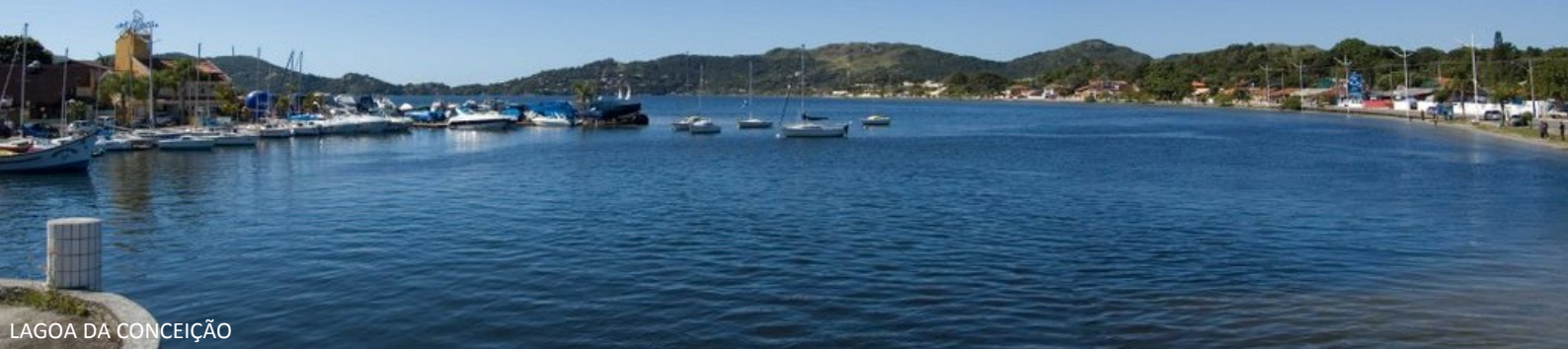
LAGOA DA CONCEIÇÃO