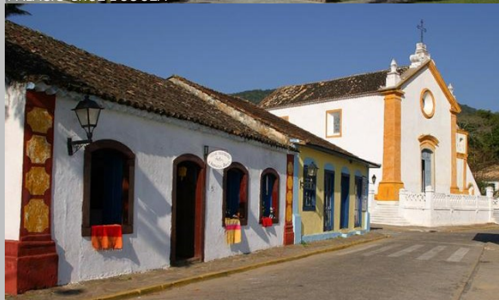
SANTO ANTÓNIO DE LISBOA