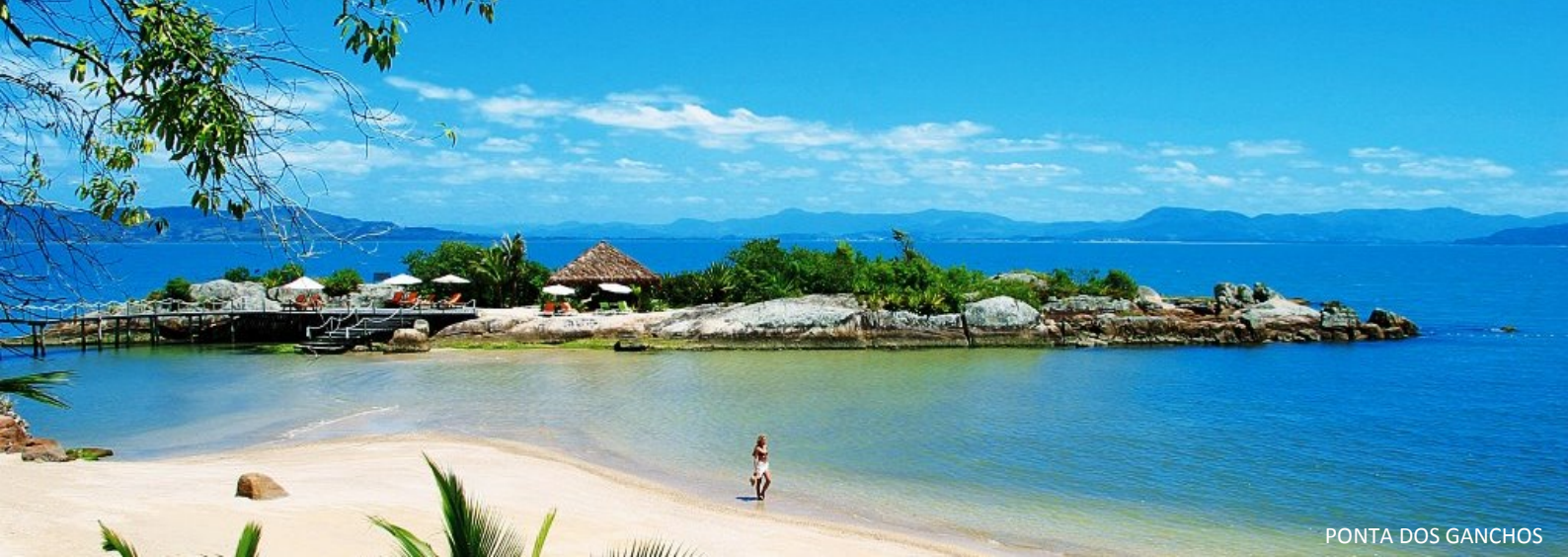
PONTA DOS GANCHOS