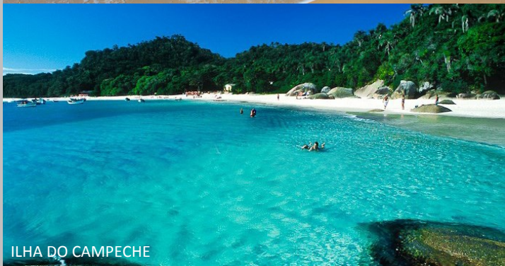
ILHA DO CAMPECHE