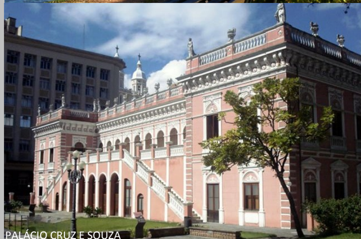
PALÁCIO CRUZ E SOUZA