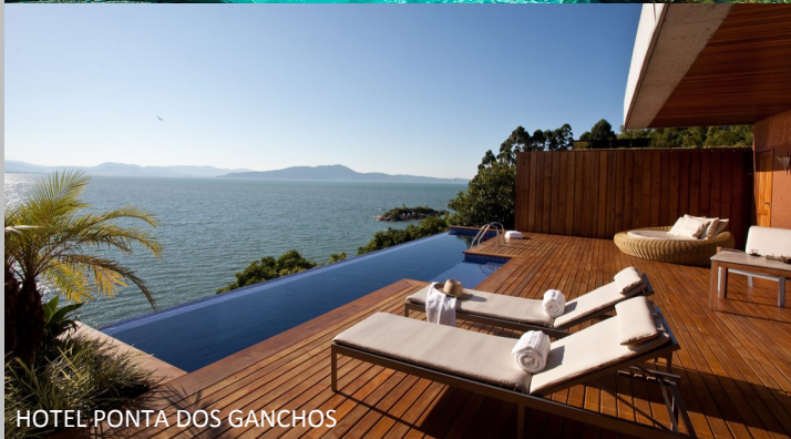
HOTEL PONTA DOS GANCHOS