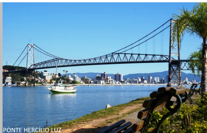
PONTE HERCÍLIO LUZ

Conhecida pelas muitas praias, a Ilha de Santa Catarina é perfeita para a prática de desportos náuticos, especialmente o surf e mergulho, além de contar com passeios marítimos, belas dunas e trilhas que oferecem caminhadas ecológicas. A preservação do meio ambiente e uma extraordinária biodiversidade, possibilitam uma infinidade de opções. As praias mais famosas são as do Mole, Joaquina e Moçambique para os surfistas no leste, e Jurerê, Ingleses, Daniela, com águas calmas para toda a família, no norte. Não deixe de ir à ilha de Campeche à frente da praia de Campeche.