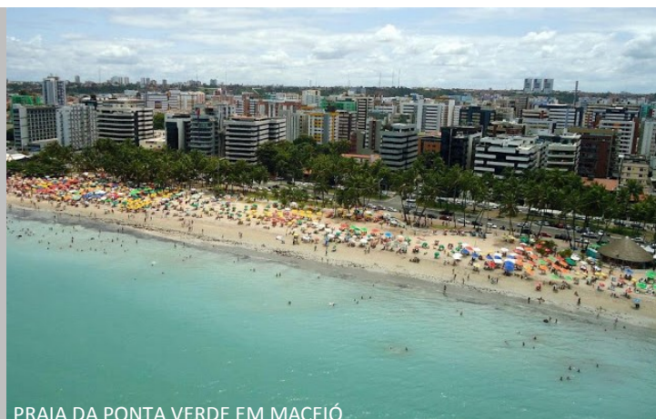
PRAIA DA PONTA VERDE EM MACEIÓ

O passeio é feito em dias e horários que variam de acordo com a tabela das marés. Deverá visitar-se o local durante a maré baixa. Por causa da preservação ecológica, cada barco pode ficar apenas duas horas no local, o que é o suficiente. Aproveite para esquecer os problemas e relaxar ao lado de diversas espécies de peixes e outros pequenos animais marinhos.