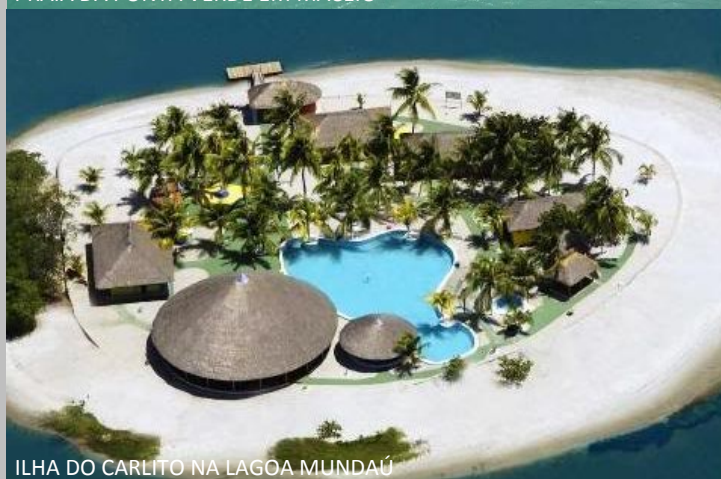
ILHA DO CARLITO NA LAGOA MUNDAÚ