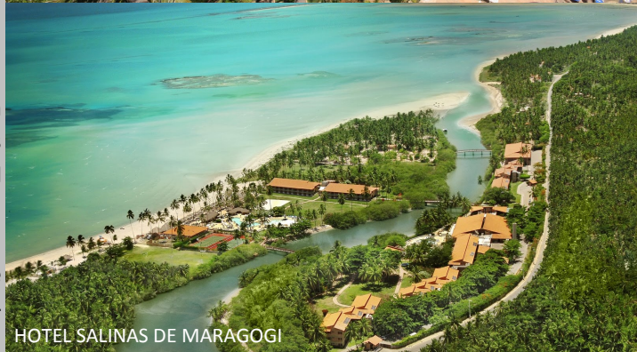
HOTEL SALINAS DE MARAGOGI