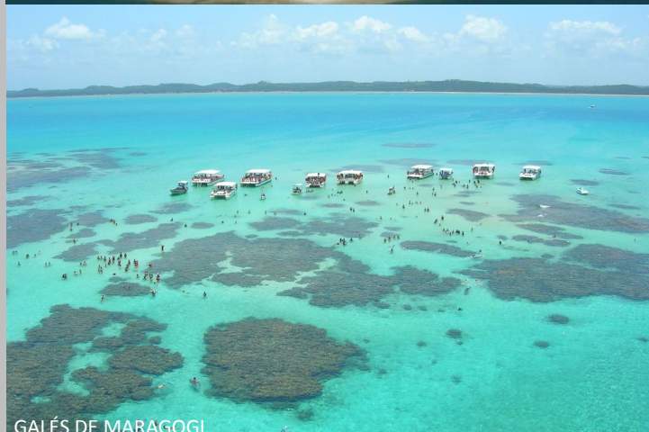
GALÉS DE MARAGOGI