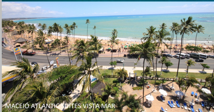
MACEÍO ATLANTIC SUITES VISTA MAR